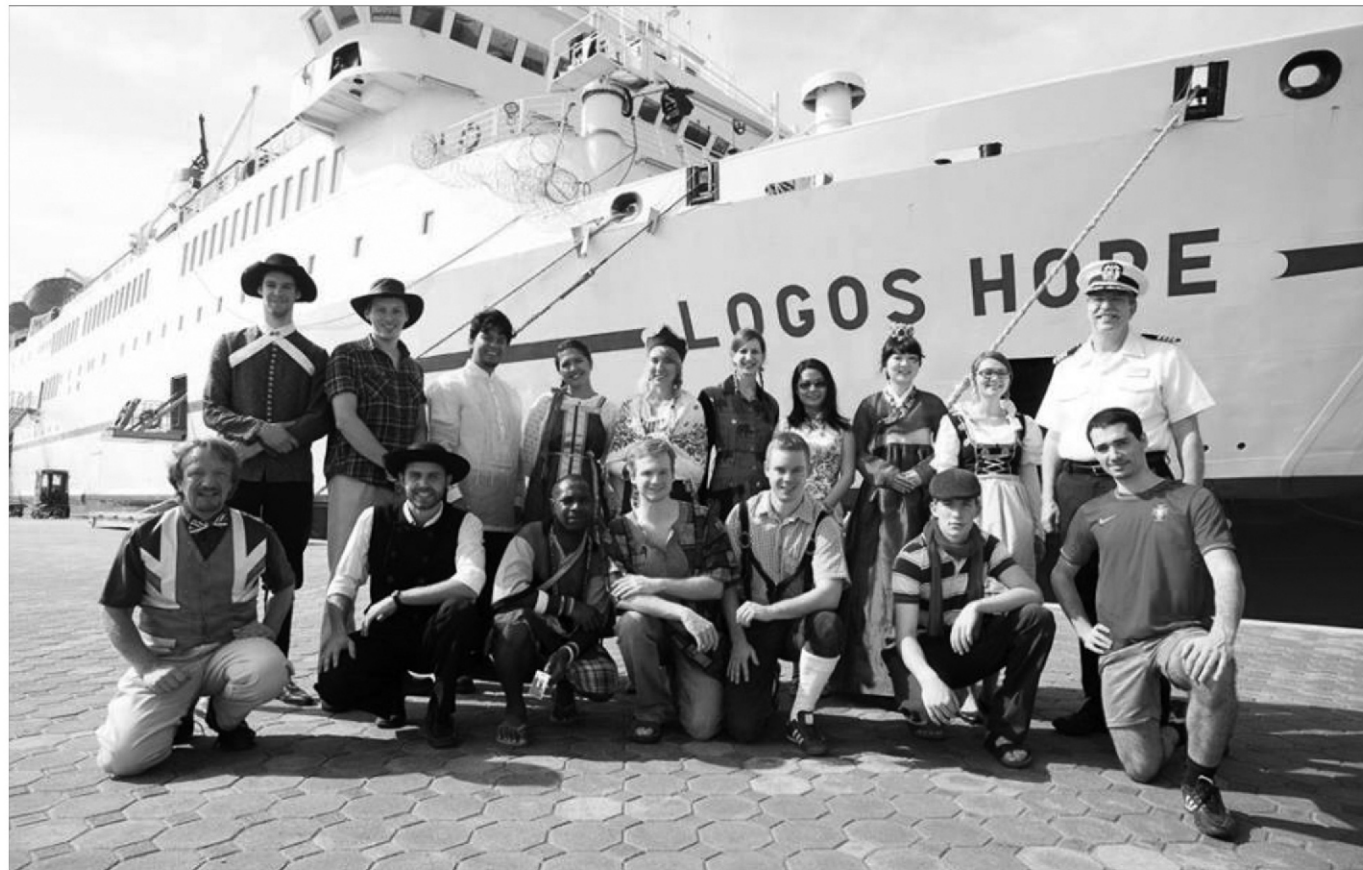
Membros da tripulação vestidos com os seus "trajes nacionais". Foto oficial, em Ras Al Khaimah (Emirados Árabes Unidos).