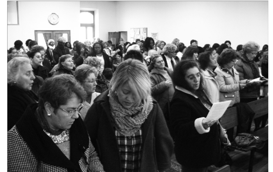
Participantes do Convívio da Amizade, na Igreja Congregacional de Ponte de Sor, a 30/11/2013.